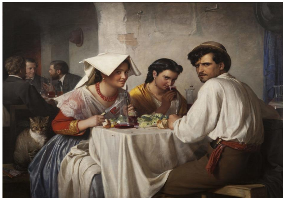
Carl Bloch "Fra et romersk osteria" 1866 (SMK)

Inden besøget på den lokale restaurant, skal I beslutte jer for, hvordan I skaber jeres måltids-parafraze med udgangspunkt i Carl Blochs maleri " Fra et romersk osteria ".