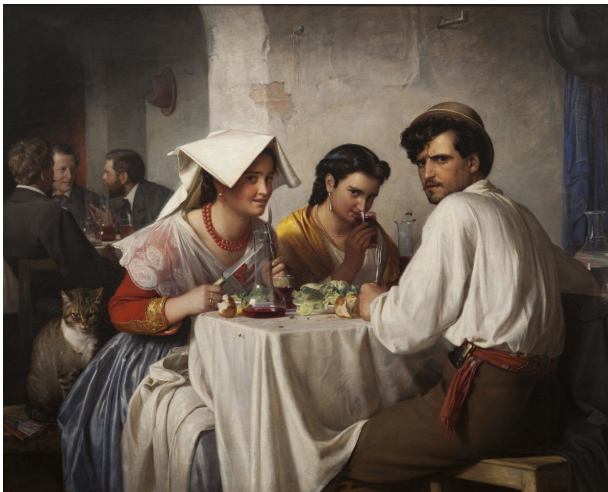
Carl Bloch "Fra et romersk osteria" 1866