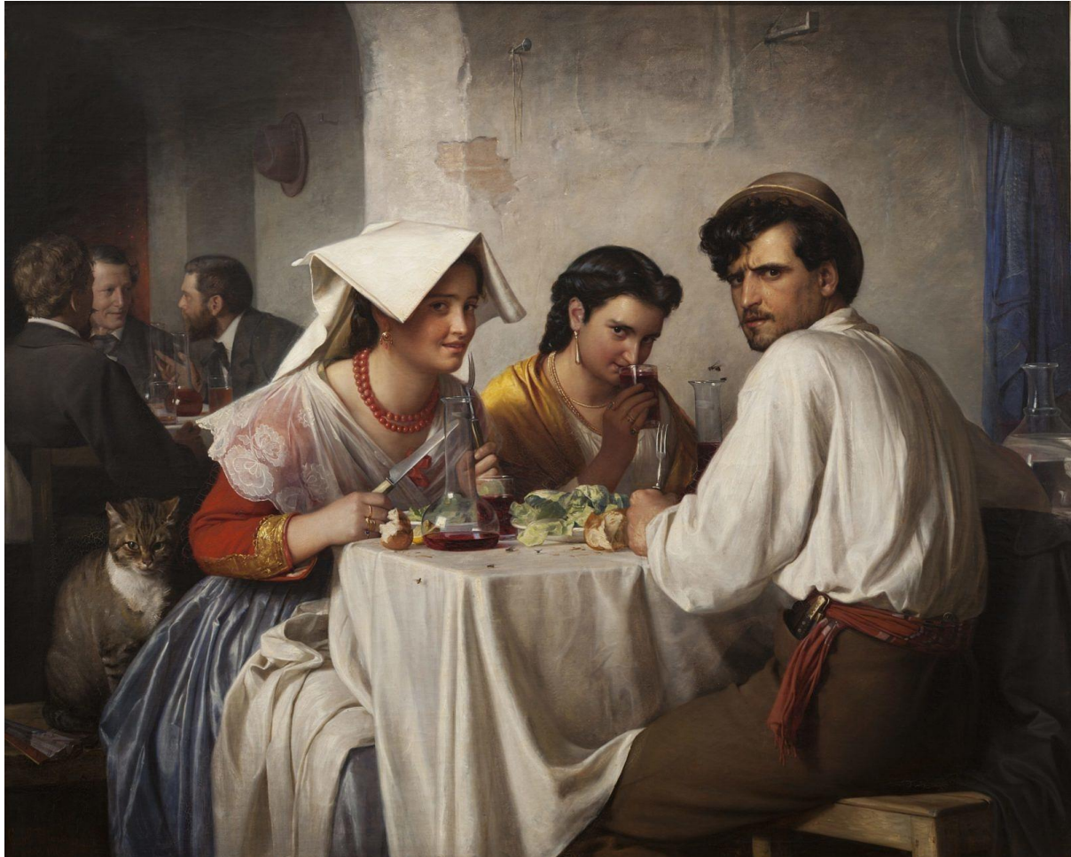
Carl Bloch "Fra et romersk osteria" 1866

Kig godt og længe på billedet. Start evt. i det ene hjørne og bevæg dig gennem billedet. Brug gerne de værktøjer, du har lært i de foregående aktiviteter.