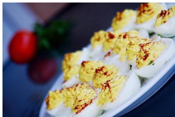
Deviled Eggs.

I dag opfattes æg oftest som et morgenmadsprodukt. Dog med en undtagelse: 'deviled eggs', som spises ved uformelle picnics og som hors d'oeuvre i restauranter. Retten menes at stamme fra sydeuropæiske køkkener og optræder i kogebøger fra midten af 1800tallet i talrige udgaver. De har endda deres egen 'National Deviled Eggs Day' d. 2. november hvert år. Der findes andre æggeretter i restaurationskøkkenet, blandt andet er der i Charles Ranhofer's 'The Epicurean' henved 100 æggeretter.