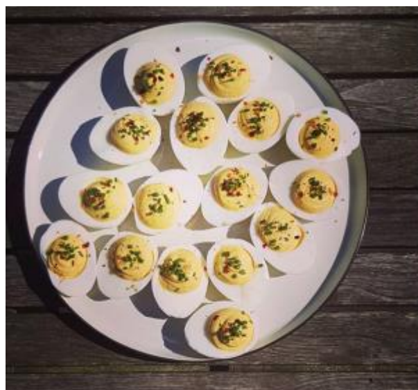
Deviled eggs