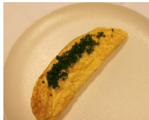
Omelette nature fra Larousse: Foto af Simon Sørensen

Æg slås ud i en skål og der tilsættes en smule salt og peber. Blandingen piskes med en gaffel indtil den er homogen og luftig. Kom halvdelen af smørret på en pande, sæt blusset på høj varme og hæld æggeblandingen på, når smørret bruser op. Sørg for at æggene stivner ensartet på panden. Når æggene har den rette konsistens, vendes den ene halvdel ind over den anden. Lad den foldede omelet glide over på en tallerken